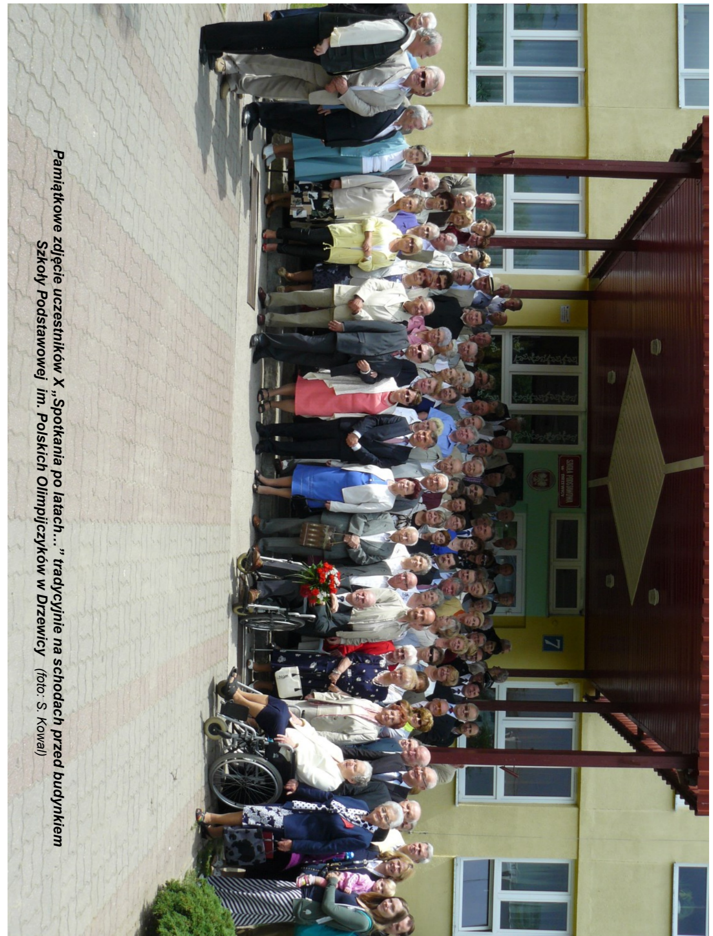
Pamiętkowe zdjęcie uczestników X „Spotkania po latach...” tradycyjnie na schodach przed budynkiem Szkoły Podstawowej im. Polskich Olimpijczyków w Drzewicy

Poziom układów tanecznych różnych formacji i kategorii był imponujący. Widownia zachwycona, biła nieustające brawa, wyrażała uznanie za sztukę tańca i sprawności oraz dziękowała za przeżycia artystyczne i estetyczne.