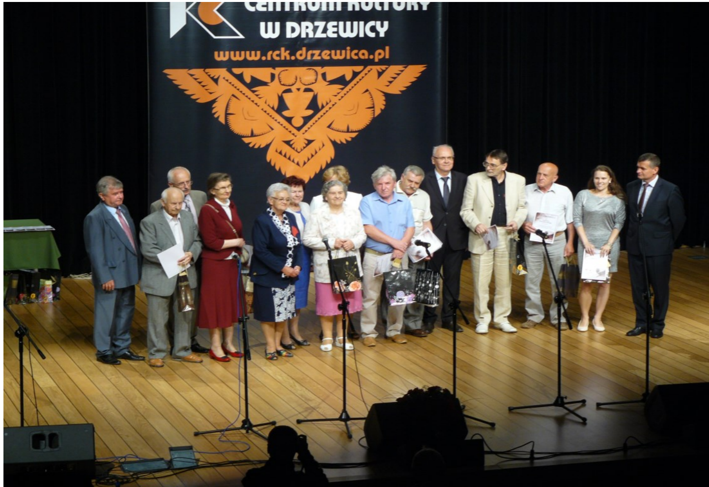
Laureaci i organizatorzy pierwszej edycji konkursu „Drzewica w poezji”

A oto kilka nagrodzonych i wyróżnionych limeryków: