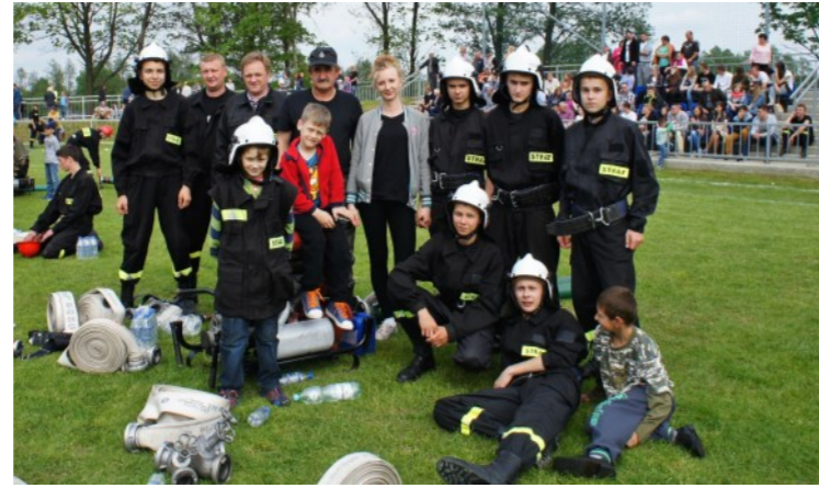
Chwila wytchnienia przed konkurencją „ćwiczenie bojowe”