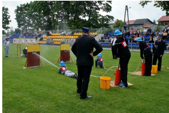
W zawodach liczyła się nie tylko szybkość...