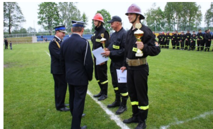
Zwycięzcy z dumą dźmiżą zdobyte puchary