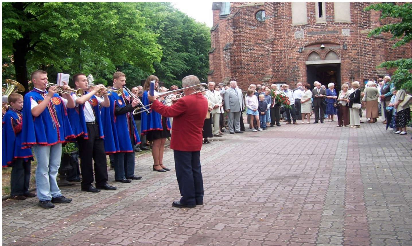
Uczestnicy I „Spotkania po latach” przed świątynią drzewicką.

„Spotkania po latach w Drzewicy” miały swój początek 17 czerwca 2006 r. Właśnie na ten dzień Towarzystwo Przyjaciół Drzewicy zaprosiło drzewiczanki i przyjaciół miasta – czytelników „Wieści znad Drzewiczki” – na spotkanie.