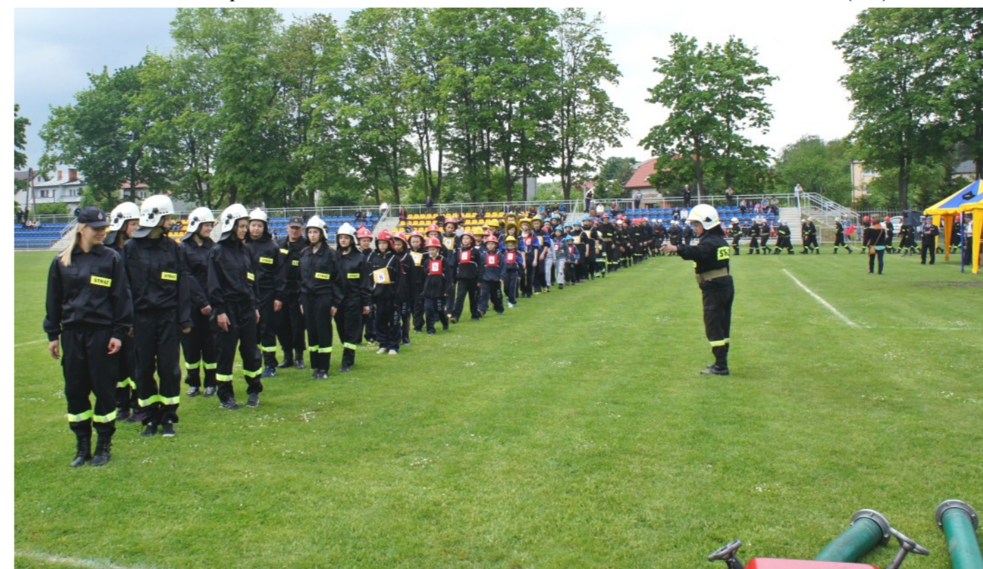
Strażacy wchodzą na płytę drzewickiego stadionu, gdzie odbędzie się odprawa a następnie zawody