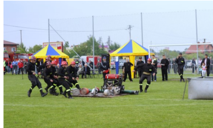
O wygranej decydowała sprawność całego zespołu