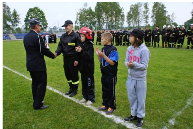
Koniec zawodów – czas na pochwały i nagrody