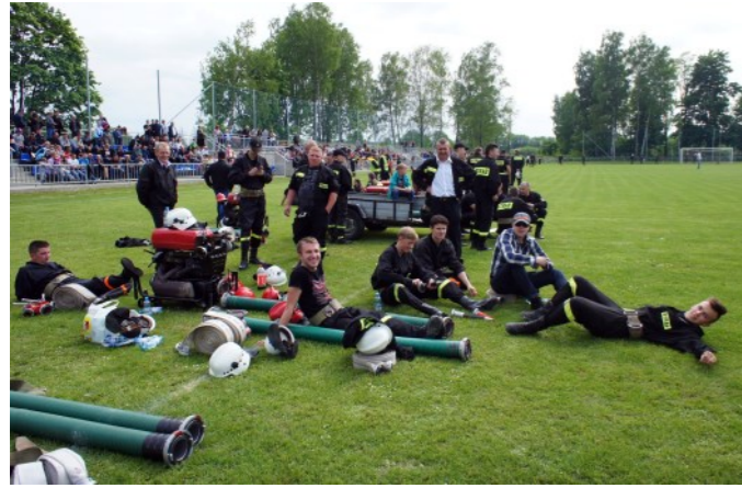
Sprzęt gotowy – oczekiwanie na rozpoczęcie zawodów