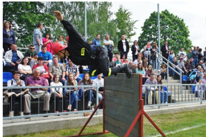
O punkty walczono z największym poświęceniem