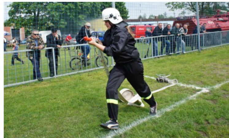
Jury oceniało dziewczyny nie za urodę...