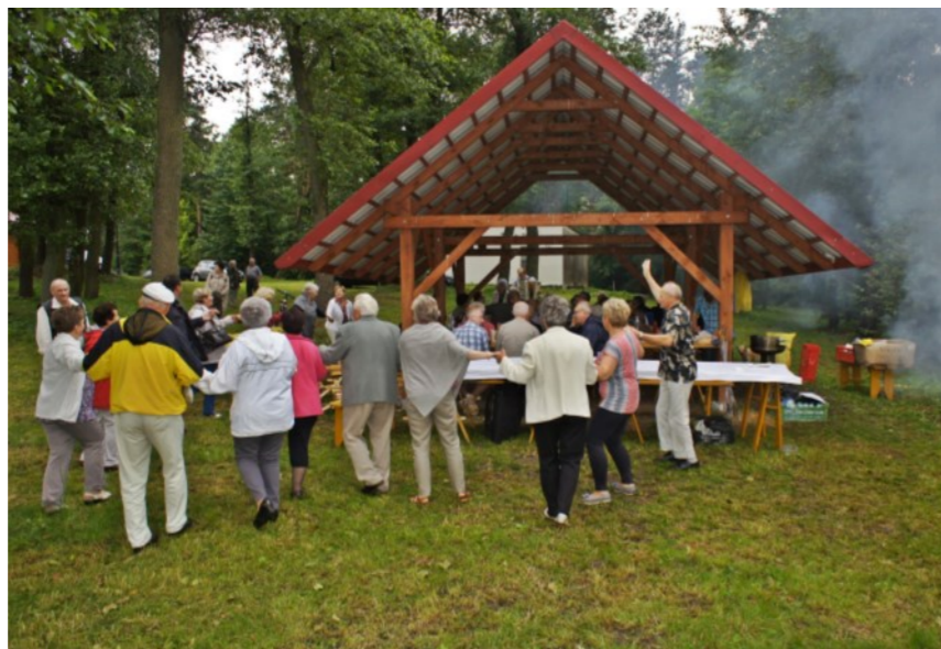
Zabawa uczestników IX zjazdu przy ognisku na Skale