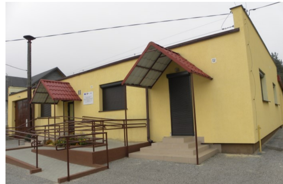
Świetlica Wiejska w Zakoscielu