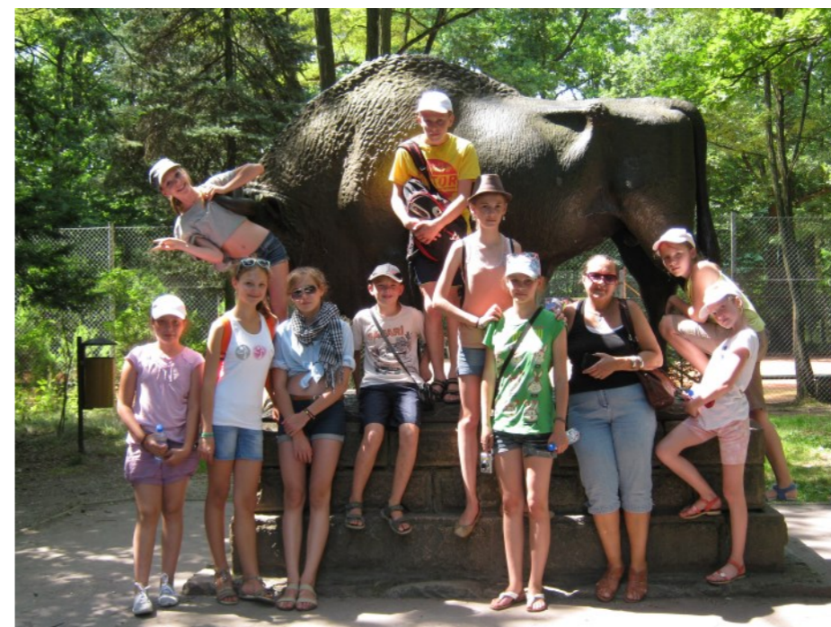
Ukraińscy goście przed pomnikiem żubra w Spale