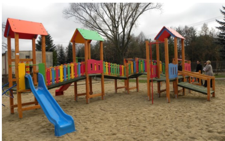
Jeden z licznych placów zabaw