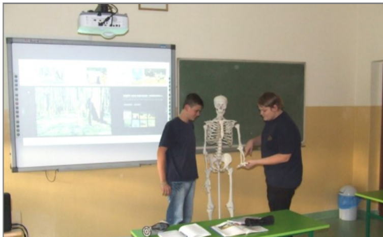
Eko-Pracownia w Gimnazjum w Drzewicy