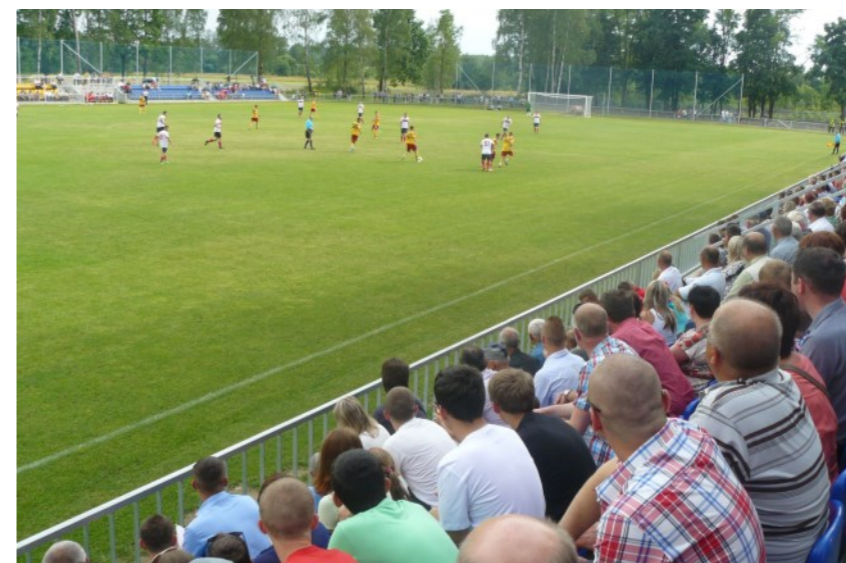
Mecz otwarcia stadionu: KS Gerlach Drzewica – Korona Kielce