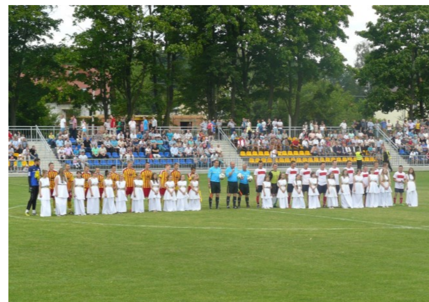
Otwarcie stadionu KS Gerlach Drzewica