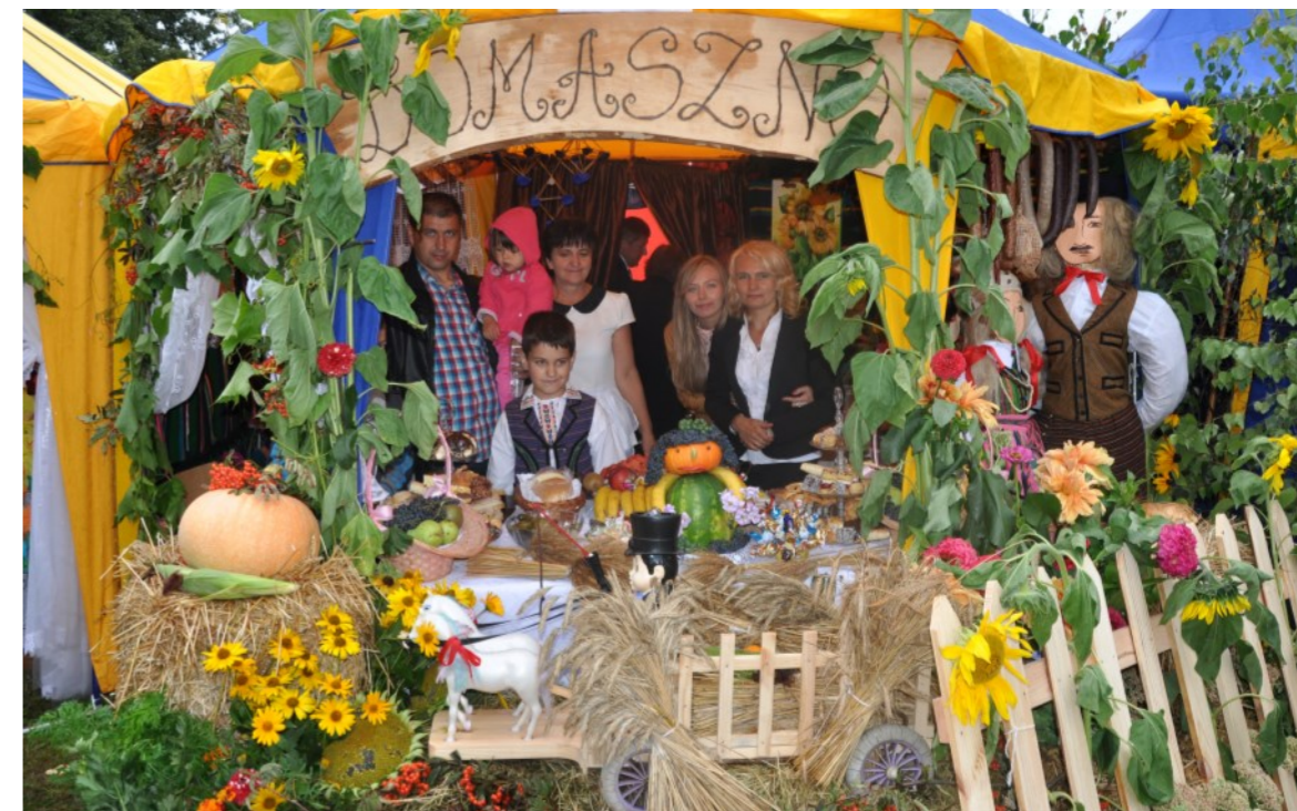
Wiejska chata przygotowana przez mieszkańców Domaszna - gospodarzy tegorocznych dożynek