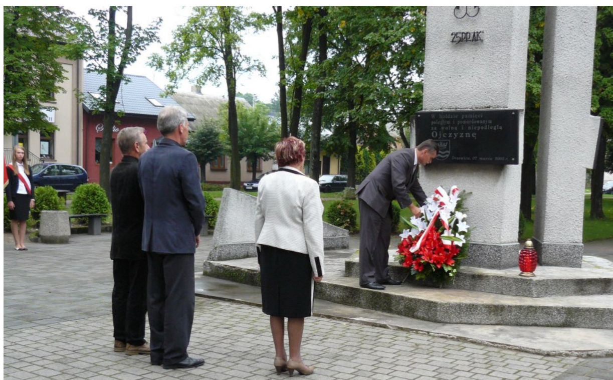
Przedstawiciele władz gminnych złożyli wieniec pod pomnikiem na Placu Wolności

Przy dźwiękach werbli Młodzieżowej Orkiestry Dętej , która swoją grą uświetniła uroczystość, Burmistrz z Przewodniczącą złożyli w stóp pomnika wieniec od społeczeństwa gminy i miasta.