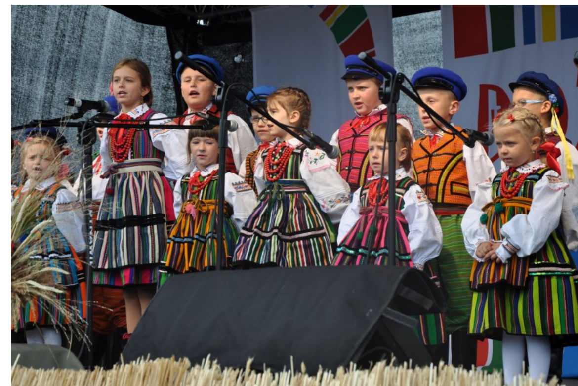
Występują „Mali Drzewiczanie”

Na scenie trwały występy regionalne: ośpiewanie wieńca dożynkowego przez mieszkańców Domaszna i Żardek, dowcipny występ Koła Gospodyń Wiejskich z Werówki, debiut „Małych Drzewiczian”, występ Warsztatu Terapii Zajęciowej oraz koncerty – zespołu „Drzewiczanie” i zespołu wokalnego „Mulieres”. Kolejne występy zespołów śpiewaczych i muzycznych rozbawiły wszystkich uczestników dożynek, którzy do godz. 1.00 tańczyli przy zespole „Janiki”.