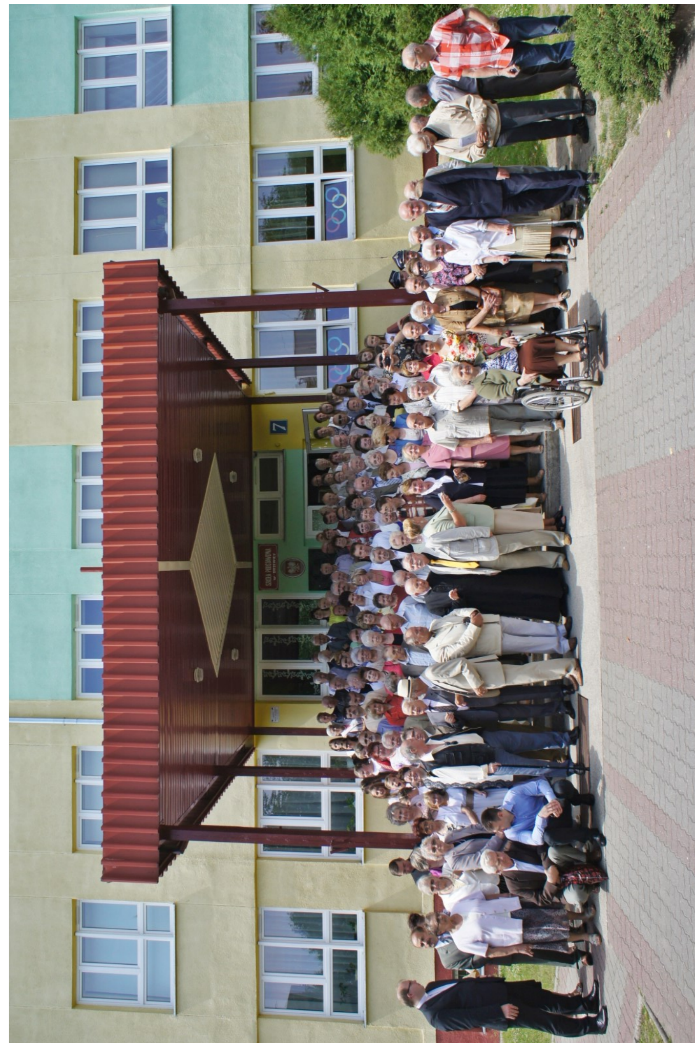
Pamiętkowe zdjęcie uczestników IX „Spotkania po latach” przed Szkołą Podstawową w Drzewicy