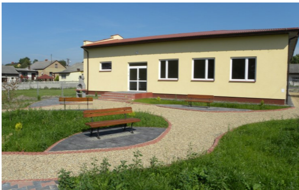
Świetlica Wiejska w Dąbrówce