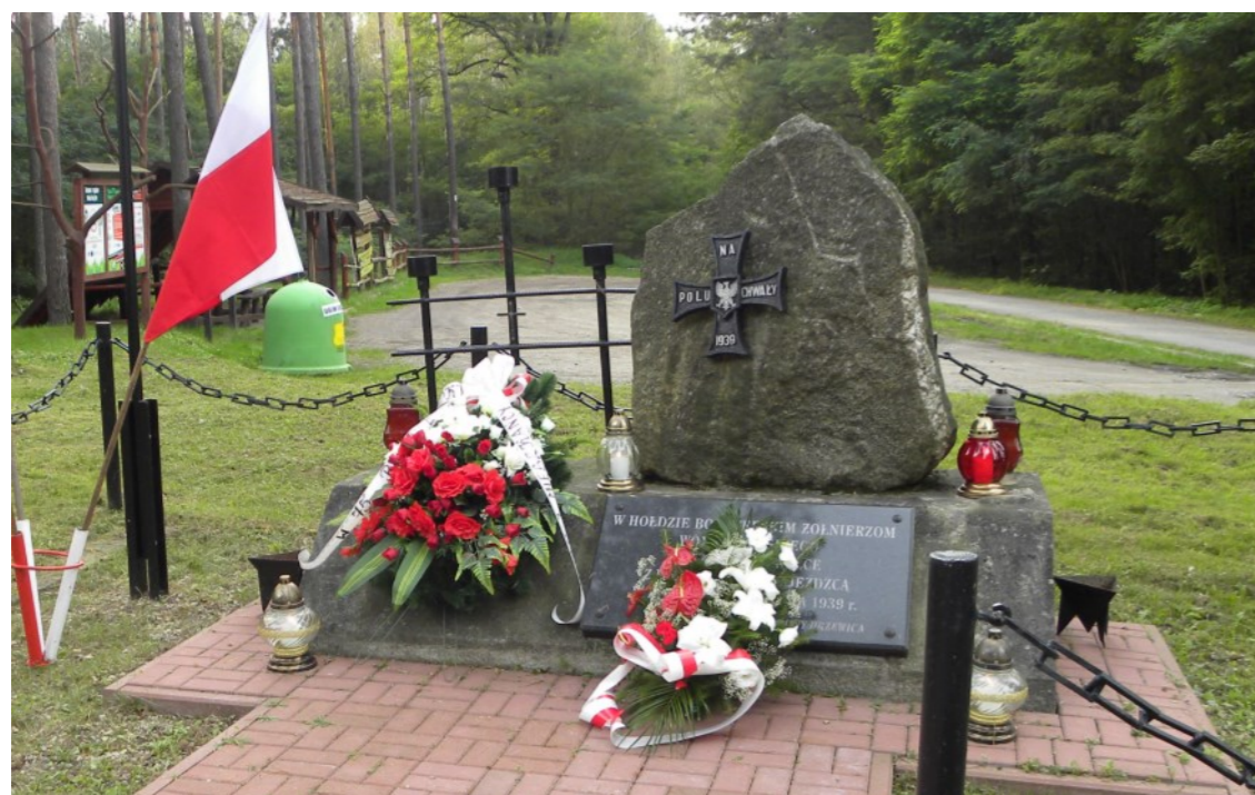
Pomnik kamienny w lesie Parchowiec odsłonięty 1 września 1982 r. Projekt – Ryszard Bogatek. Pomnik wykonali pracownicy „Gerlacha”

Delegacja mieszkańców i strażaków udała się do lasu Parchowiec i złożyła wieniec przy kamieniu upamiętniającym wrześniey bój.