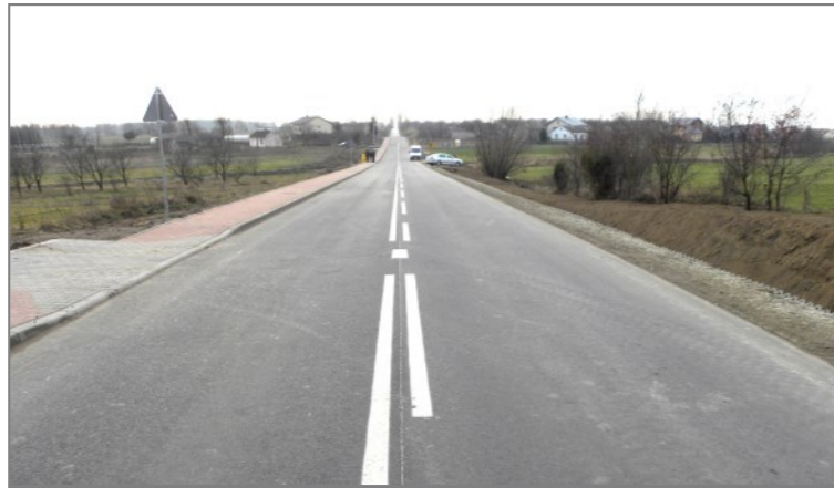
Droga w Jelni