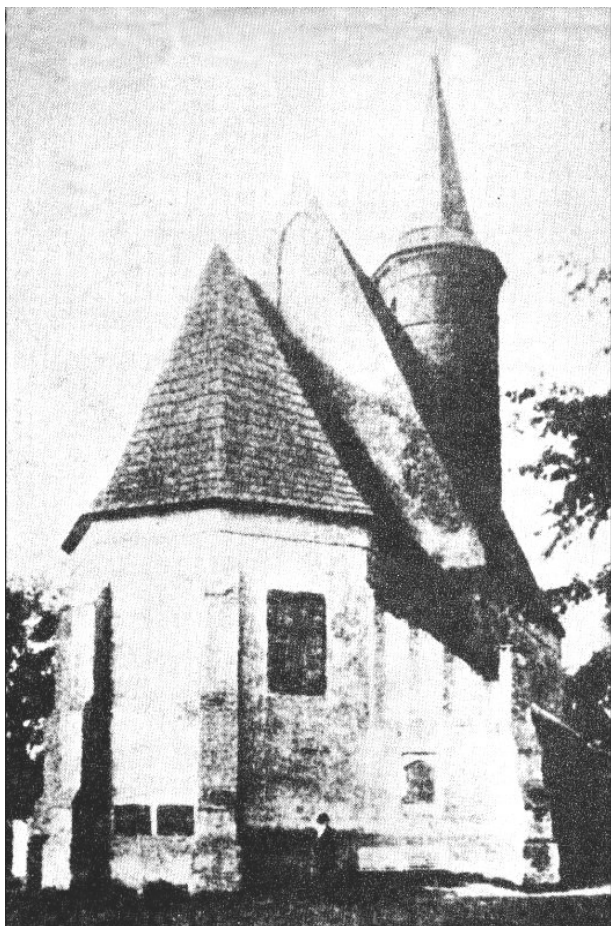
Stary kościół przed rozbudową w 1912 r.