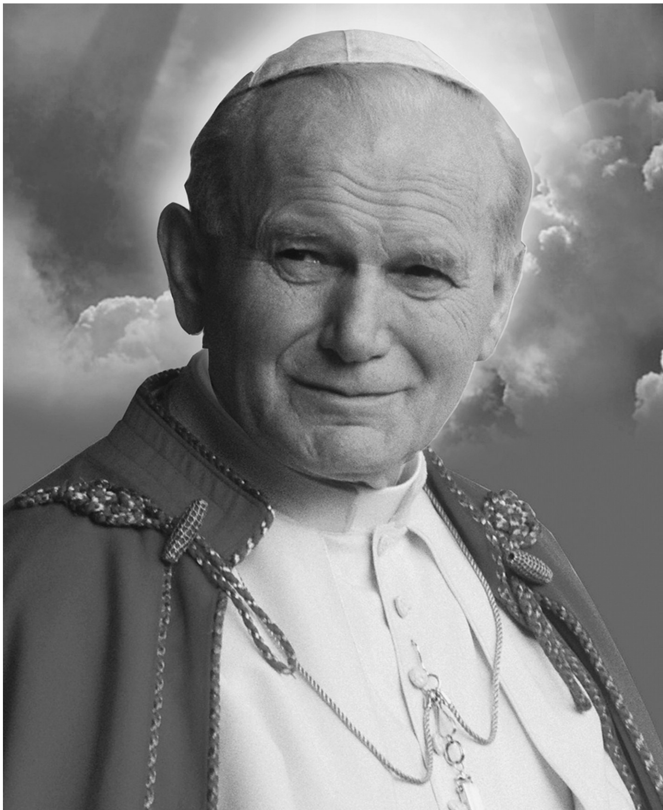
Karol Wojtyła (1920 – 2005)