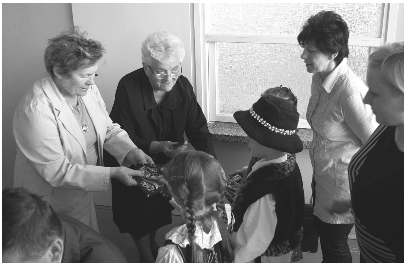
Drzewickie przedszkolaki wspólnie z paniami wychowawczyniami dziękują Towarzystwu Przyjaciół Drzewicy za udzielone wsparcie

Obrady rozpoczęły się miłą niespodzianką. Przedszkolaki wspólnie z paniami wychowawczyniami podziękowały za wsparcie, jakiego Towarzystwo udziela różnym przedszkolnym inicjatywom. Ostatnia pomoc to sfinansowanie zakupu góralskich kierpcy młodym tancerzom.