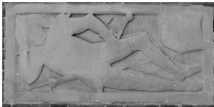
Po lewej: stara część kościoła – widok od strony południowej. U góry: płyty nagrobne Drzewickich ze startymi przez czas i buty wiernych rysami twarzy i herbami, wmurowane w północną ścianę kościoła po usunięciu z podłogi starego kościoła.