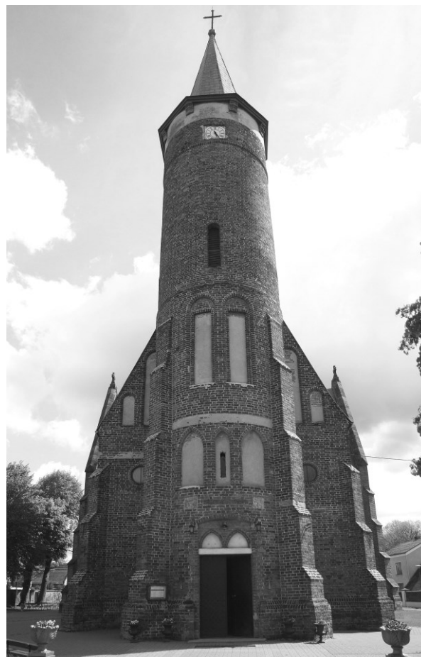
Przód starego kościoła ufundowanego w 1315 r., erygowanego na kościół parafialny w 1321 r.