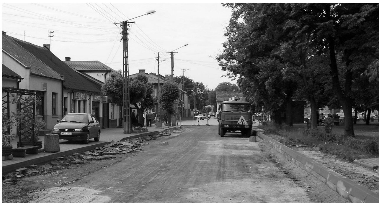
Drzewica – remont drogi

Przebudowę finansuje Zarząd Dróg Wojewódzkich w Łodzi, koszt inwestycji wynosi 13 mln. zł. Prace wykonuje Przedsiębiorstwo Robót Drogowo-Mostowych z Piotrkowa Trybunalskiego oraz Przedsiębiorstwo Projektowo-Wykonawcze „Dromos” z Łodzi. Firmy zapewniają, że ukończenie robót nastąpi pod koniec 2008 roku.