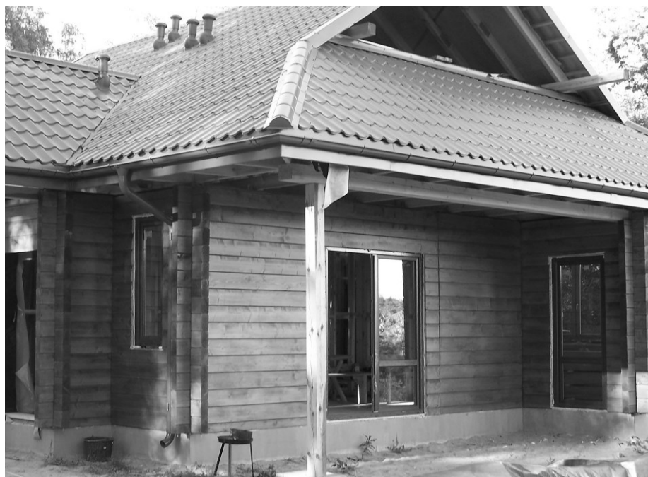
Domki nad Drzewiczką