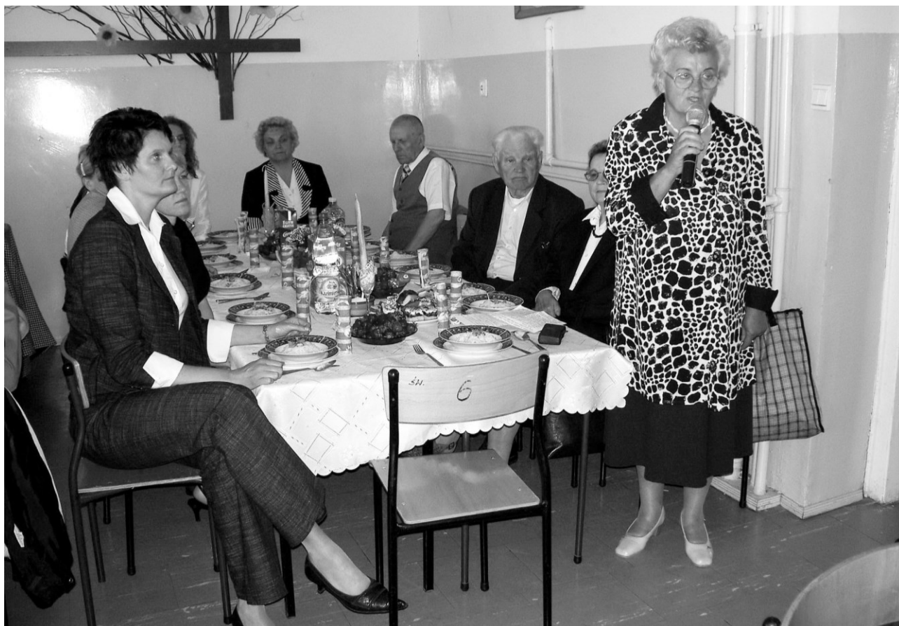
Przewodnicząca Towarzystwa Przyjaciół Drzewicy wita uczestników III Spotkania w Drzewicy

„Nie mogę się doczekać następnego spotkania, im jestem starsza, tym są one dla mnie droższe i wyjątkowo ważne. Dajcie mi szansę spotkać żywych i stanąć nad grobami najbliższych i... powspominać.” (...)