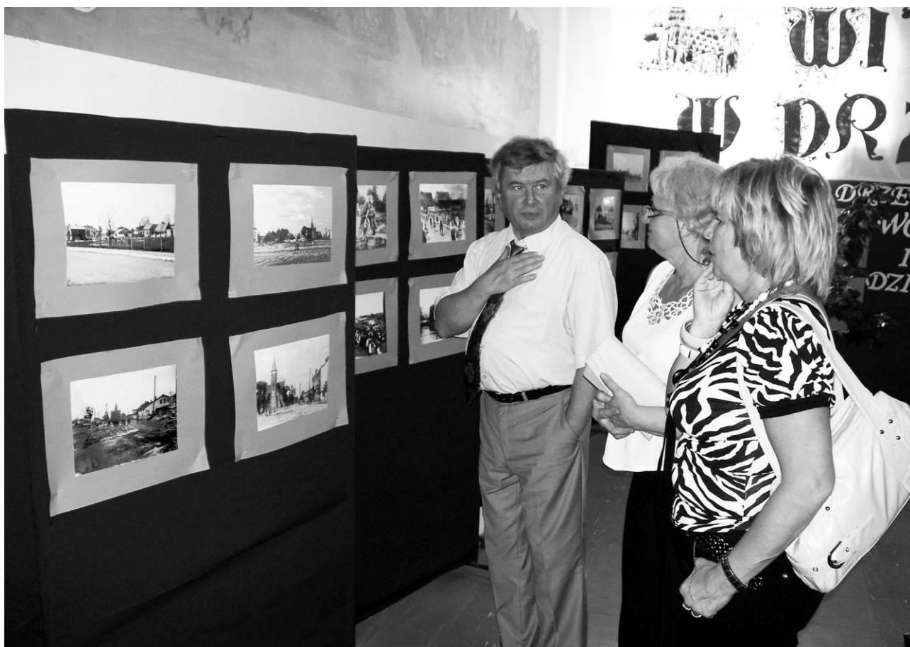
Uczestnicy spotkania zwiedzają wystawę fotografii przedwojennej Drzewicy

To, co pozostało niezmiennie wśród wszystkich obecnych – to wyjątkowa atmosfera, radość ze spotkania i refleksja nad fenomenem tego miejsca na Ziemi.