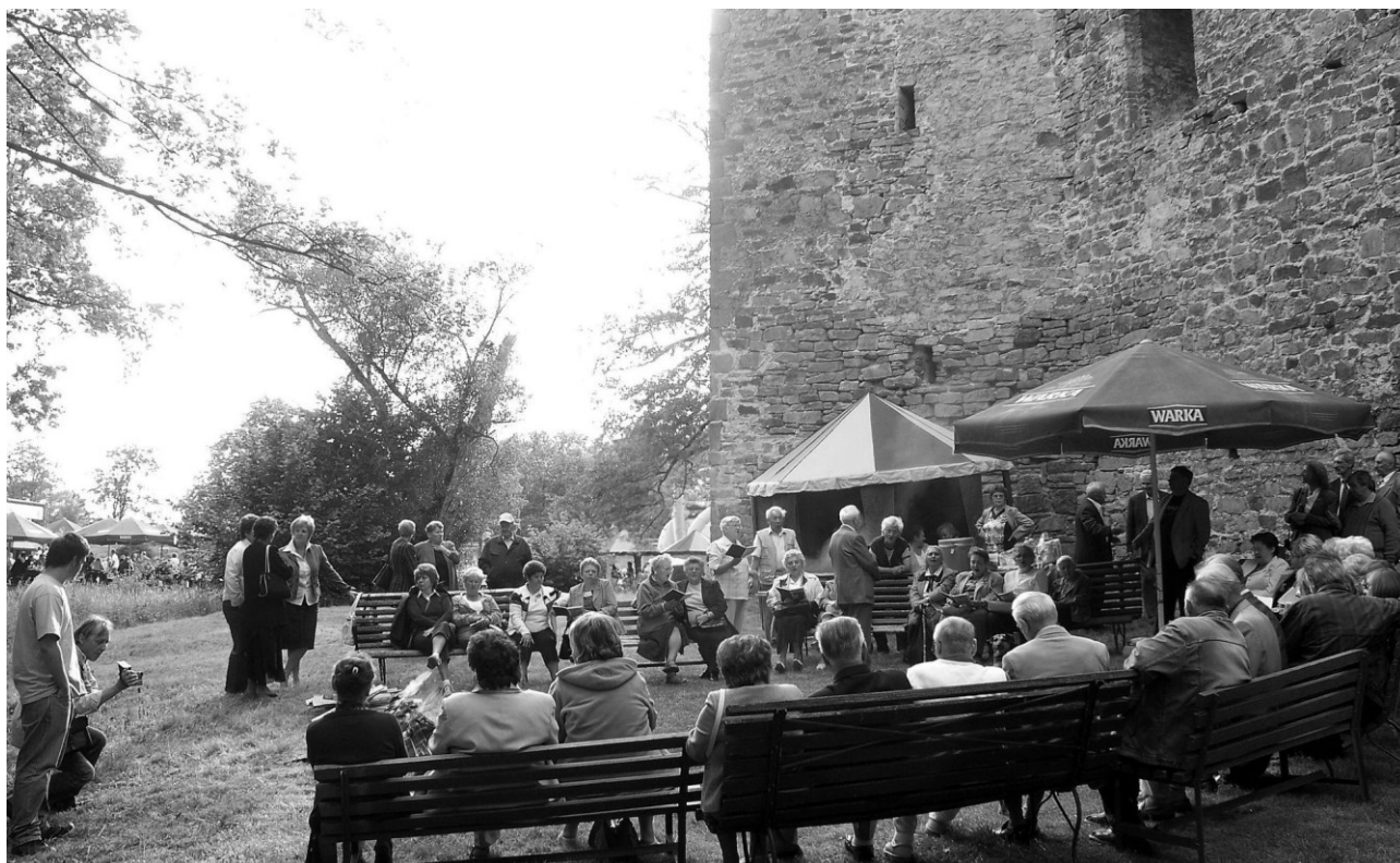
Spotkanie przy ognisku