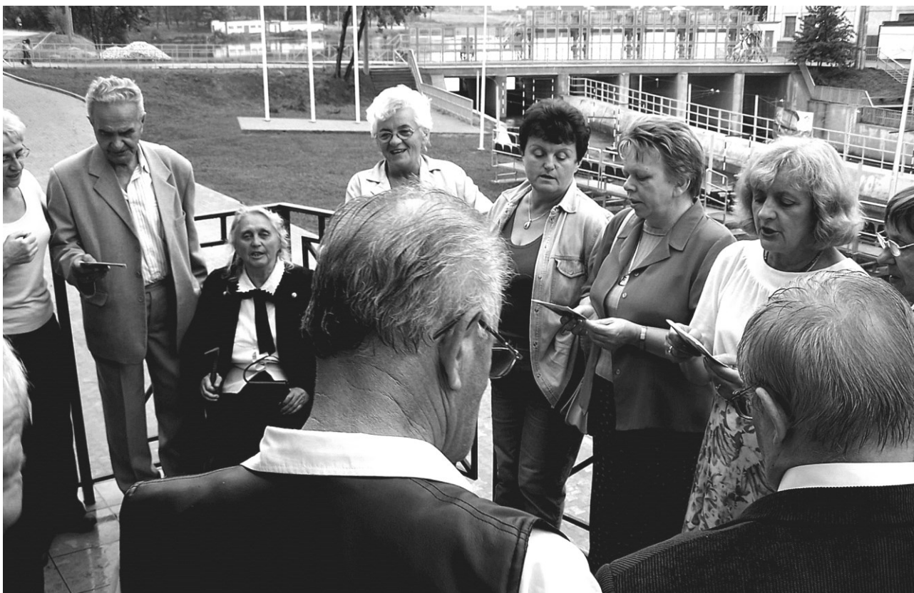
Piosenkę „Serc wyznanie” przy torze kajakowym śpiewają uczestnicy spotkania