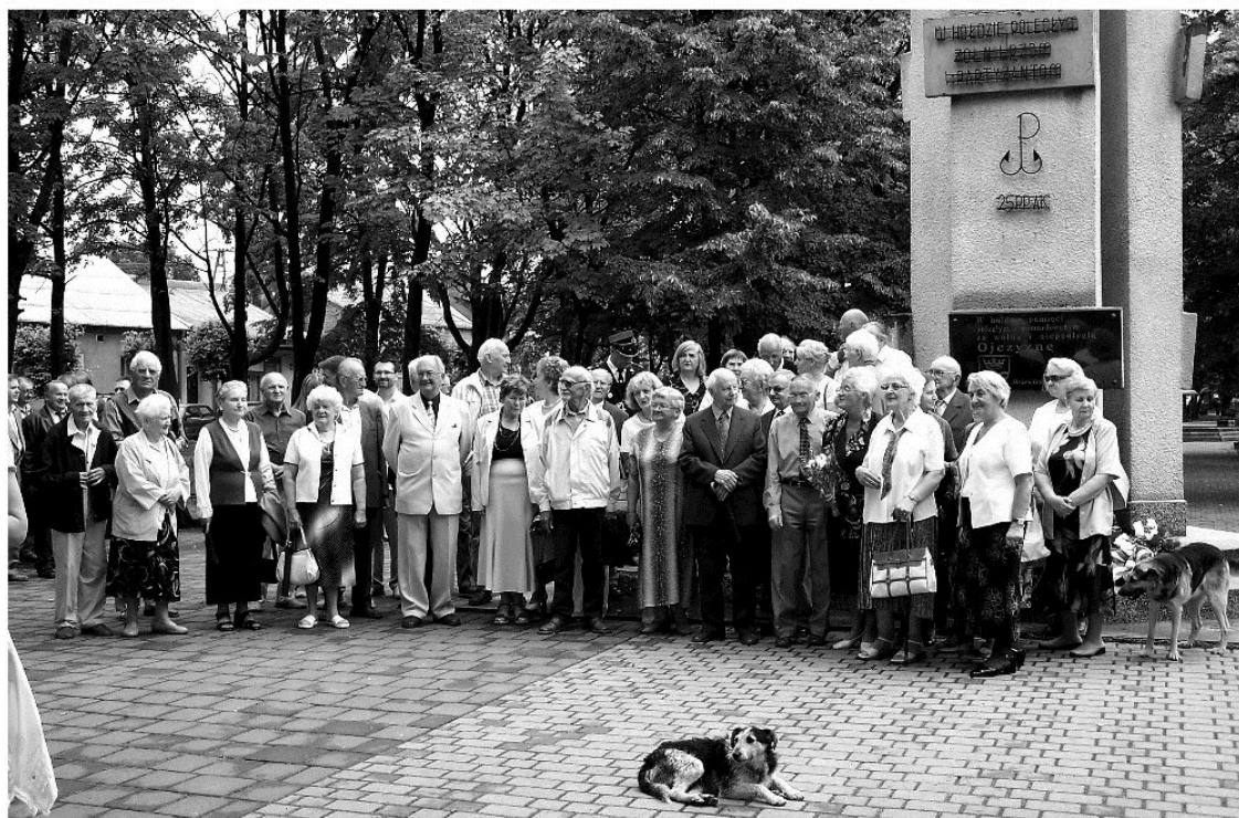
Uczestnicy "SPOTKANIA PO LATACH W DRZEWICY" przed pomnikiem na Placu Wolności

Wydanie z okazji Jubileuszu 15-lecia Towarzystwa Przyjaciół Drzewicy