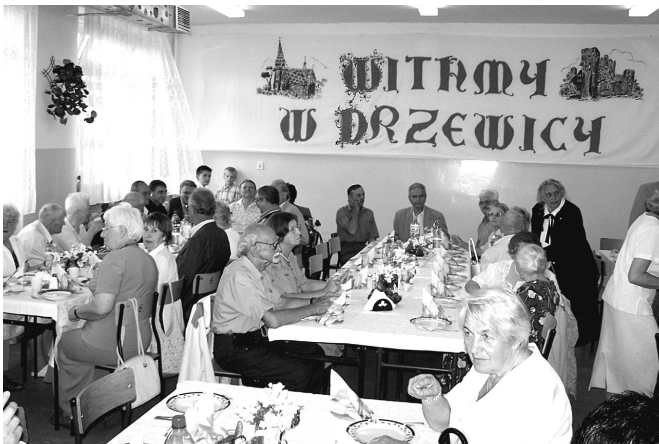
Zdjęcia pozostałych uczestników spotkania