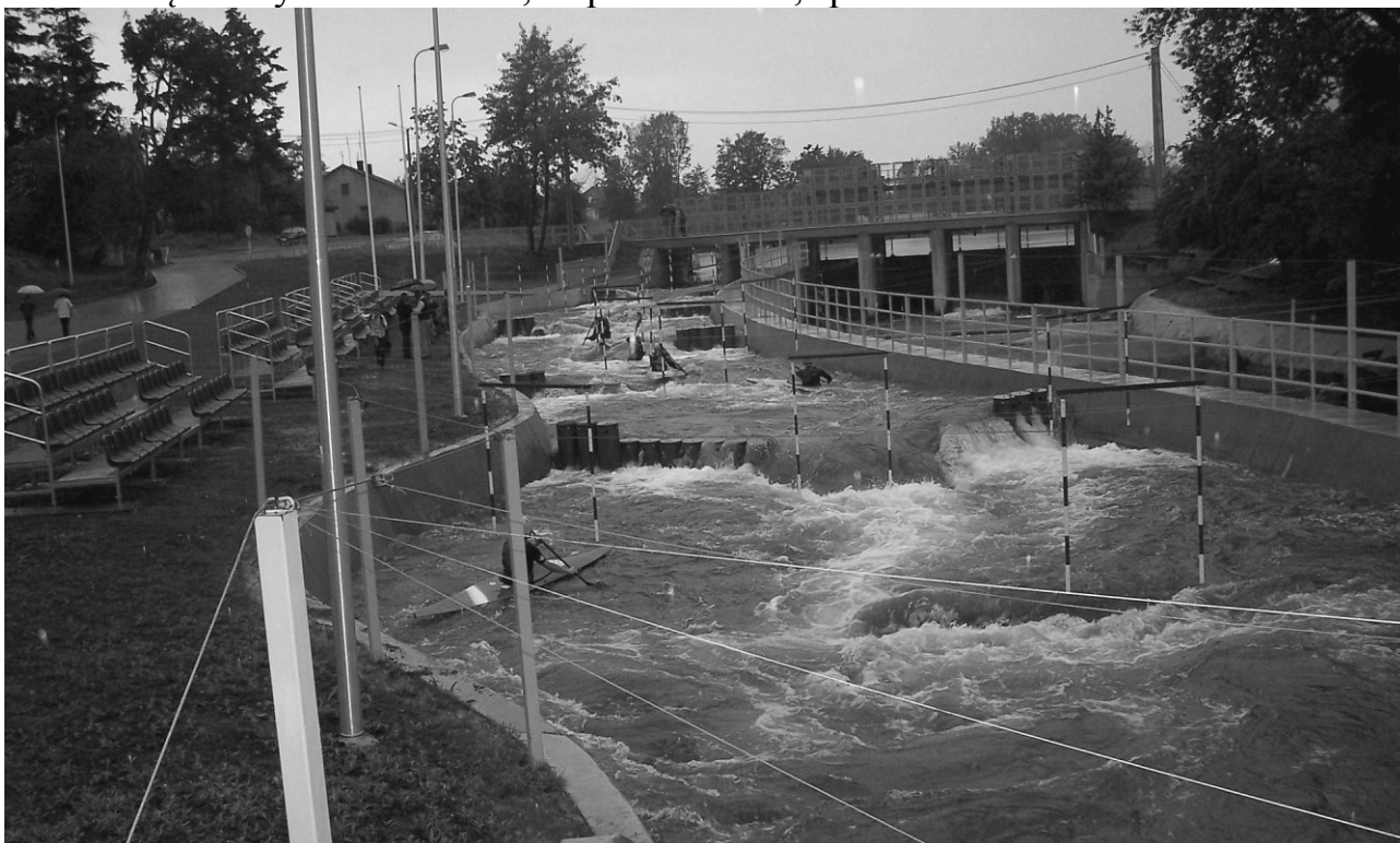
Pokaz sprawnościowy zawodników na drzewickim torze kajakowym

Po południu deszcz zakłócił nieco dalszą część SPOTKANIA. Odporni na kaprysy aury przybyli na tor kajakarstwa górskiego, gdzie przy grilu i muzyce oddano się dalszym rozmowom, wspomnieniom, śpiewom i tańcom.