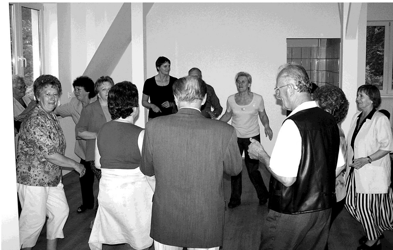
Mile spędzono czas przy wspólnych tańcach

Tak w szkole jak i przy torze kajakarstwa górskiego wszyscy uczestnicy „SPOTKANIA PO LATACH W DRZEWICY” wyrazili życzenie, potrzebę, a nawet konieczność zorganizowania „SPOTKANIA” znów za rok w Drzewicy.