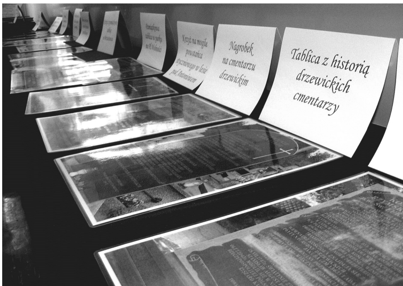
Fragment wystawy ze zdjęciami pomników postawionych na terenie gminy Drzewica.

Uczestnicy spotkania uwieczniali swoją obecność wpisami do księgi pamiątkowej.