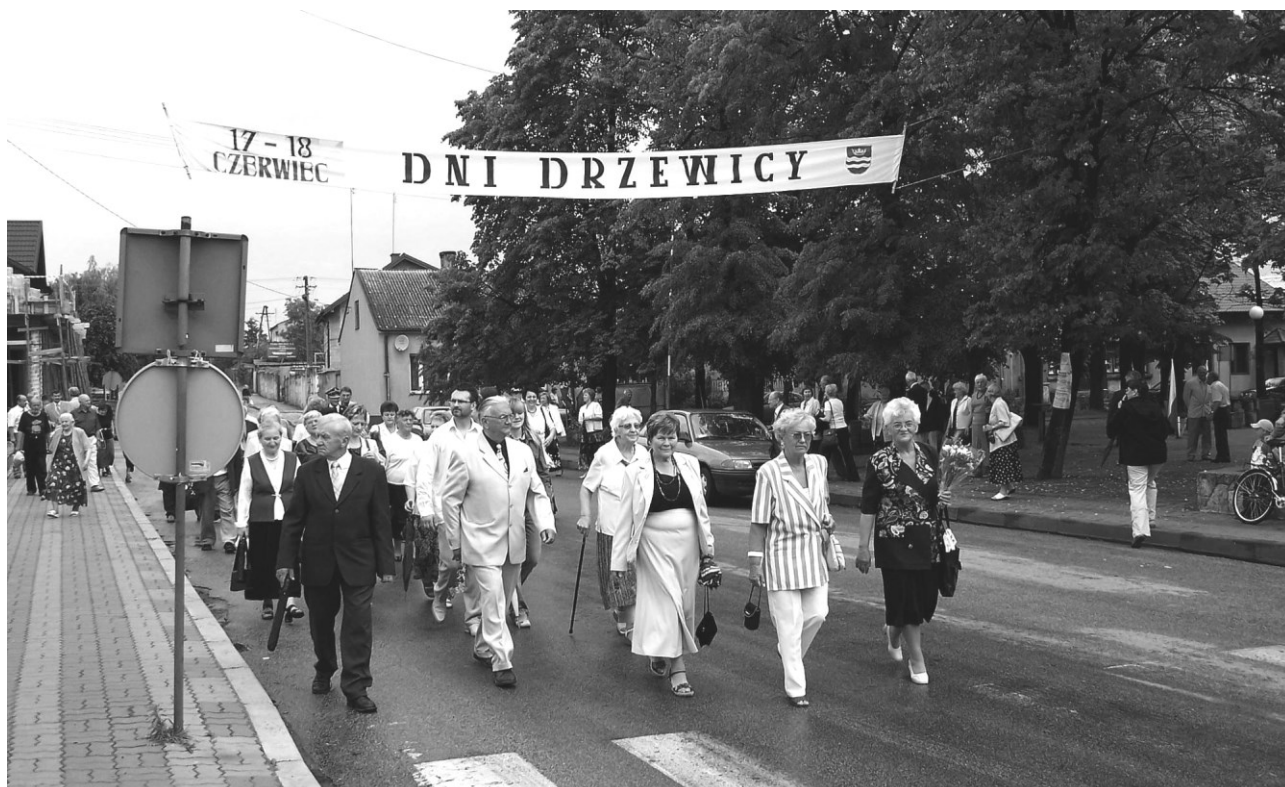
Uczestnicy spotkania w czasie przemarszu do Szkoły Podstawowej

Przed Szkołą Gości przywitał ludowymi przyspiewkami dziecięcy zespół regionalny.