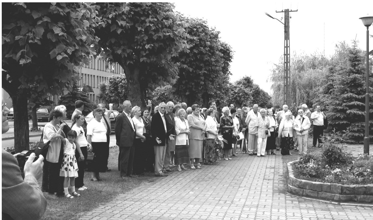
Goście i Członkowie Towarzystwa oglądają występ dziecięcego zespołu regionalnego

W holu szkolnym zaprezentowano w formie wystawy 15-letni dorobek Towarzystwa.