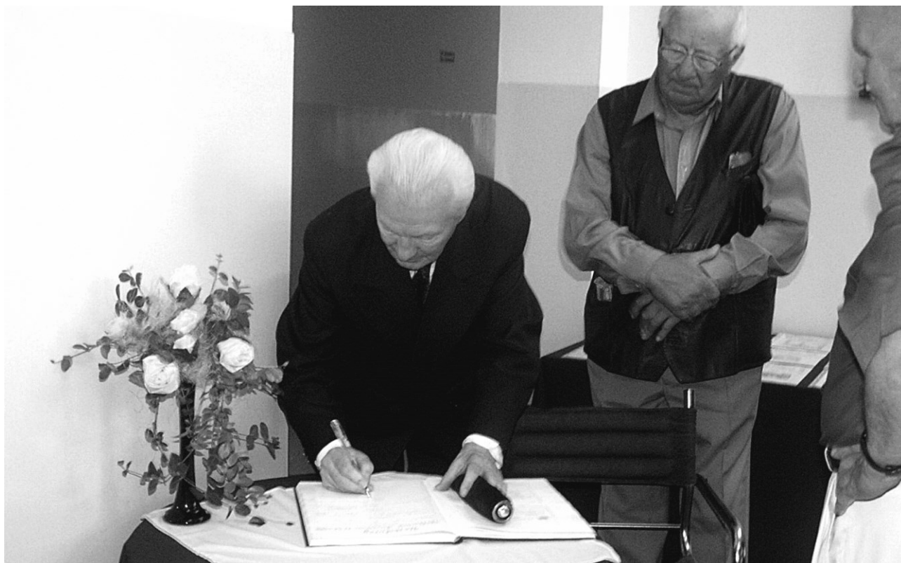
Wpisy Gości do Księgi Pamiątkowej