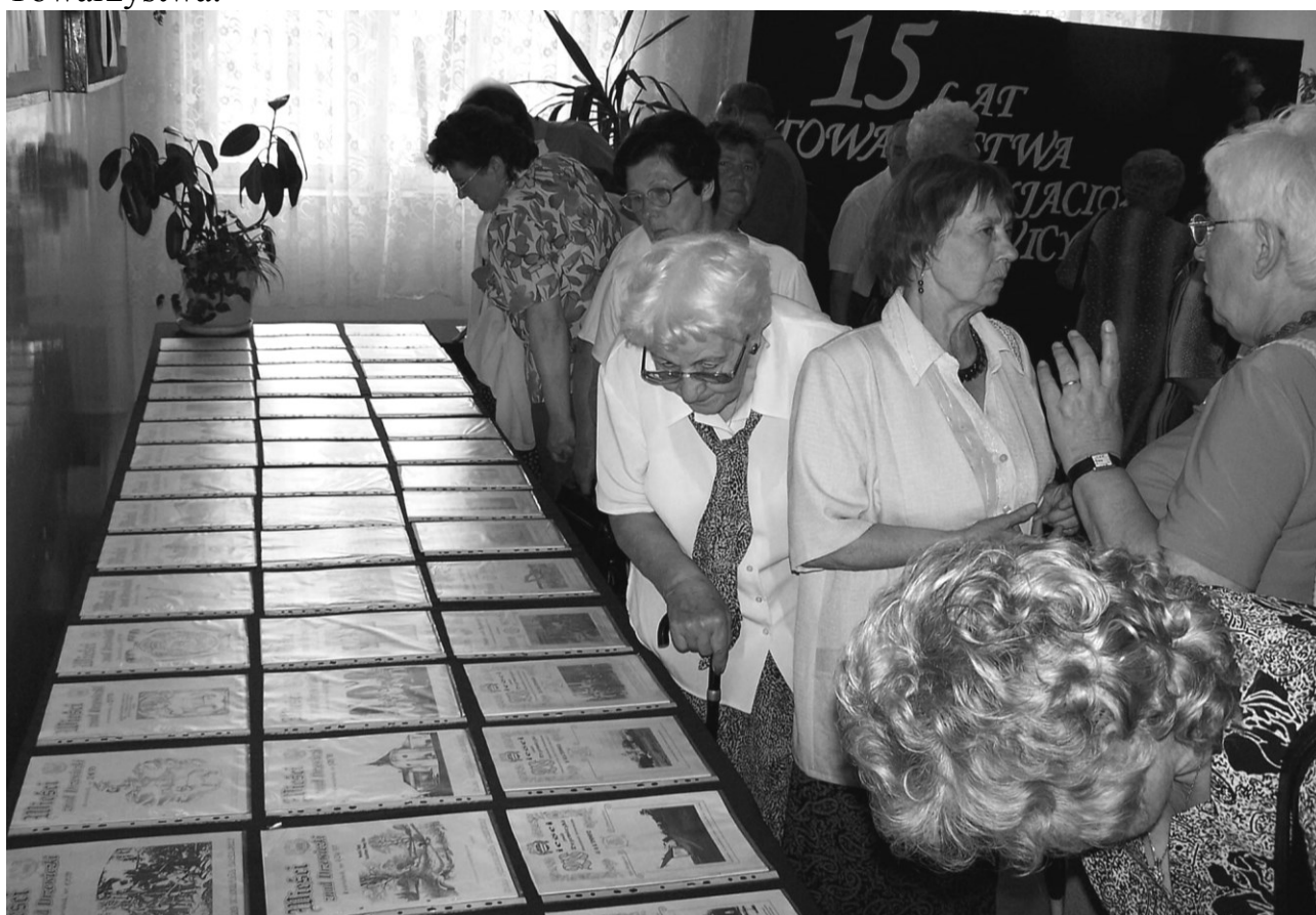
Z dużym zainteresowaniem Goście oglądali wszystkie wydania Kwartalników

W holu szkolnym zaprezentowano w formie wystawy 15-letni dorobek Towarzystwa.