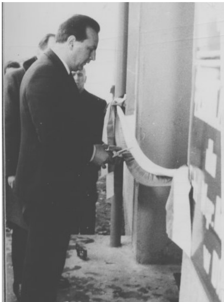
Uroczyste otwarcie budynku ZSZ w dniu 10.I.1972 r. Dyrektor Zjednoczenia Przemysłu Wyrobów Metalowych dokonuje przecięcia wstęgi