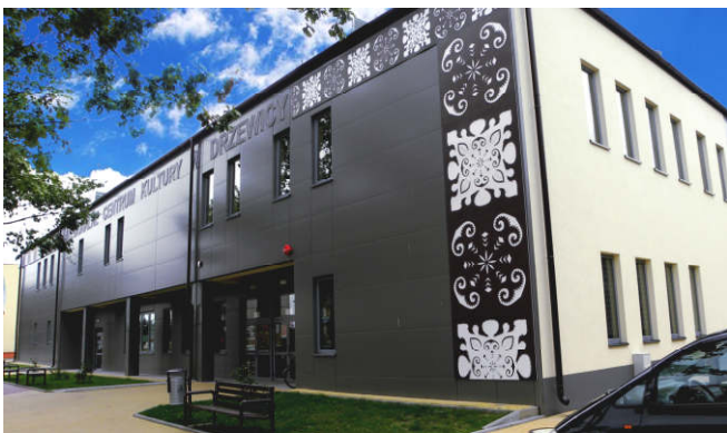
Oddanie do użytku Regionalnego Centrum Kultury w Drzewicy (2015 r.)