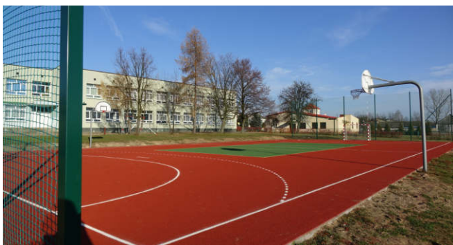
Budowa boiska wielofunkcyjnego przy SP w Domasznie (2016 r.)