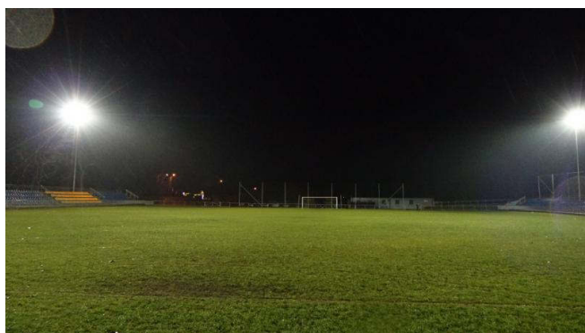
Budowa oświetlenia stadionu miejskiego w Drzewicy (2017 r.)