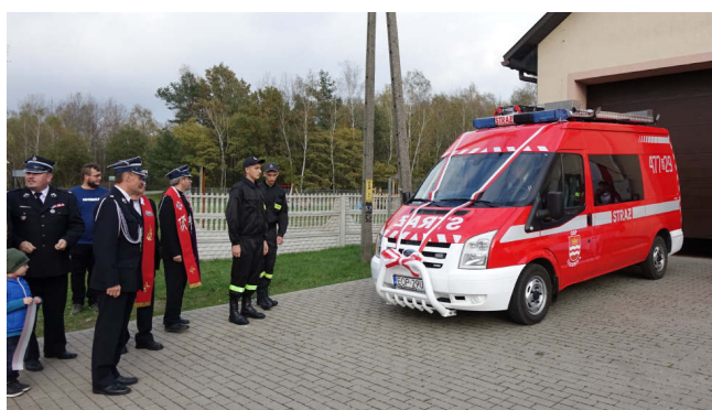
Zakup samochodu strażackiego dla jednostki OSP w Trzebinie (2017 r.)