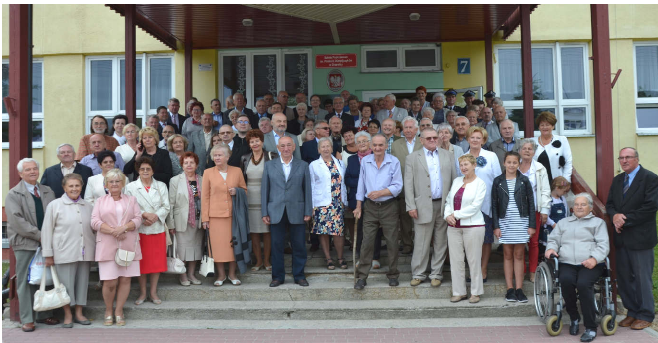
Pamiętkowe zdjęcie uczestników „XIII SPOTKANIA PO LATACH W DRZEWICY...”, które odbyło się 30 czerwca 2018 roku

Choć lat trochę przybyło i wygląd mamy już inny nic bardziej nas nie wzruszy jak powrót, gdzie Dom Rodzinny