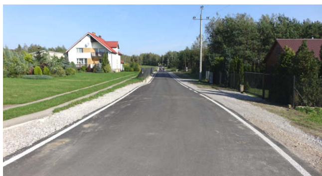
Budowa drogi gminnej w miejscowości Strzyżów (2017 r.)