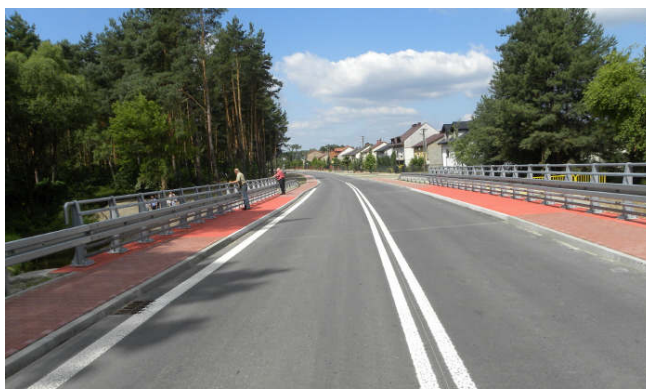
Wyremontowanie ul. Sikorskiego w Drzewicy (2015 r.)