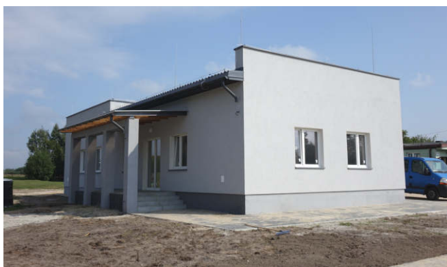
Budowa świetlicy wiejskiej w Jelni (2018 r.)