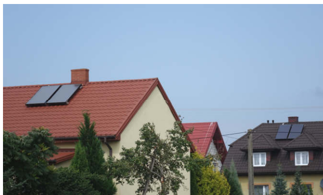
Montaż instalacji solarnych na budynkach mieszkalnych (2018 r.)